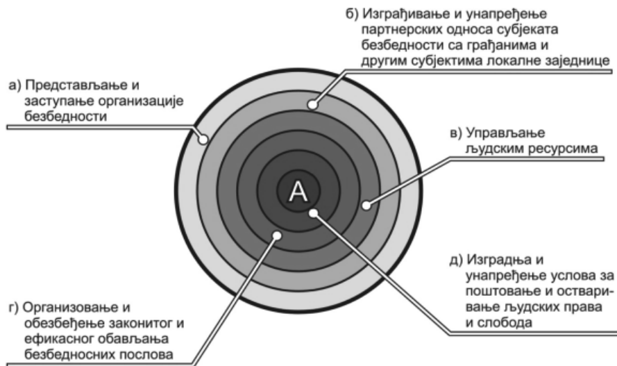
Слика 1. Улоге безбедносног менаџмента

Са прве – главне стране чине га његове улоге: (1) представљање и заступање безбедносне организације; (2) организовање и обезбеђење ефикасног и законитог обављања безбедносних послова; (3) управљање људским и другим ресурсима субјеката безбедности; (4) успостављање, изградња и унапређење партнерских односа субјеката безбедности са грађанима и другим субјектима безбедности у локалној заједници; и (5) изградња и унапређење услова за поштовање и остваривање људских права и слобода.